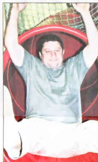
Auf zur lustigen Rutschpartie im Restaurant „Lo Scoglio“.