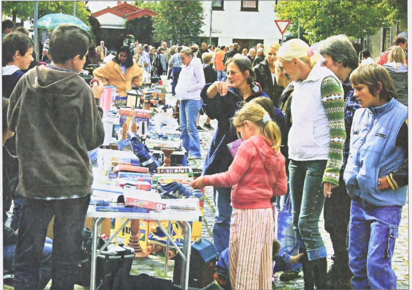
Reichlich Kundschaft bekamen die Flohmarktbesucher auf der abgesperrten unteren Freistraße.

„Schnäppchenstand“ waren von Geschäftsleuten gespendet worden. Mit dem Verkaufserlös will die Werbegemeinschaft ihre Internetseite überarbeiten und „up to date“ bringen. Ein auf Hochglanz gewieniertes