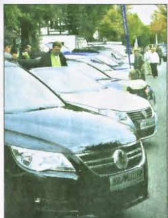
Ein Auto reihte sich gestern Nachmittag auf der Langen Straße an das andere.