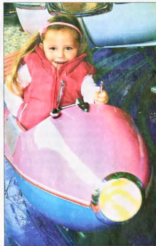
Das Karussell ließ Kinderaugen leuchten.