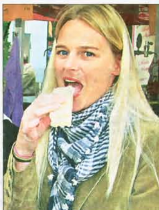
Ob süß oder herzhaf – der Herbstmarkt bot kulinarische Abwechslung.

Fahrzeug reihte sich auf der Langen Straße an das andere. Der VW EOS, ein TDI-Roadster mit Zwei-Liter-Maschine, und der Passat CC mit 160 „Pferdchen“ unter der Haube fanden ebenso Beachtung wie der neue Toyota Auris Sol, der Nissan X-Trail und viele weitere Modelle unterschiedlicher Hersteller. Acht Händler präsentierten so ziemlich alles, was die Herzen von Automobil Liebhabern höher schlagen lässt.